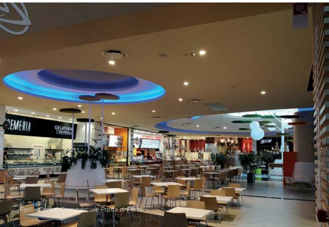
Forlì - Centro Commerciale Punta di Ferro